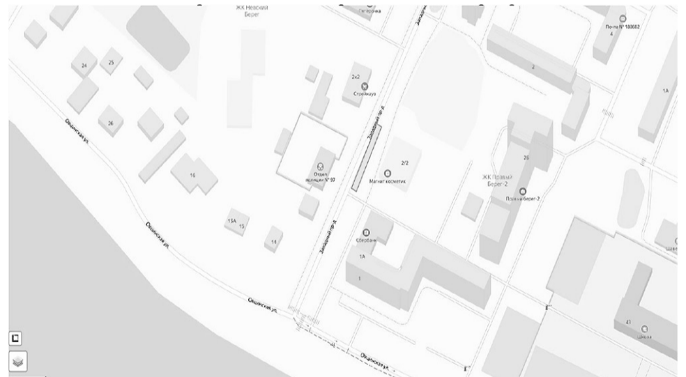
Схема расположения торговых мест на ярмарке

Условные обозначения: - границы территории размещения торговых мест вдоль Западного проезда